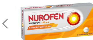
NUROFEN 200MG - BOÎTE DE 20 COMPRIMÉS